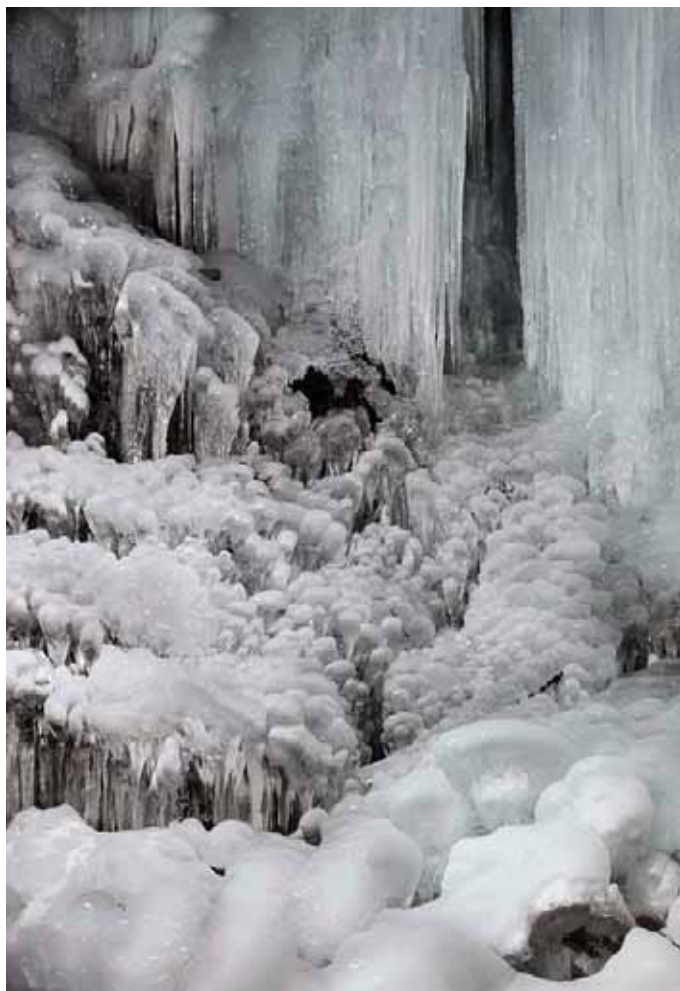
Die Vertikale, das Element des Ueli Steck. | Straight up: Ueli Steck's direction.